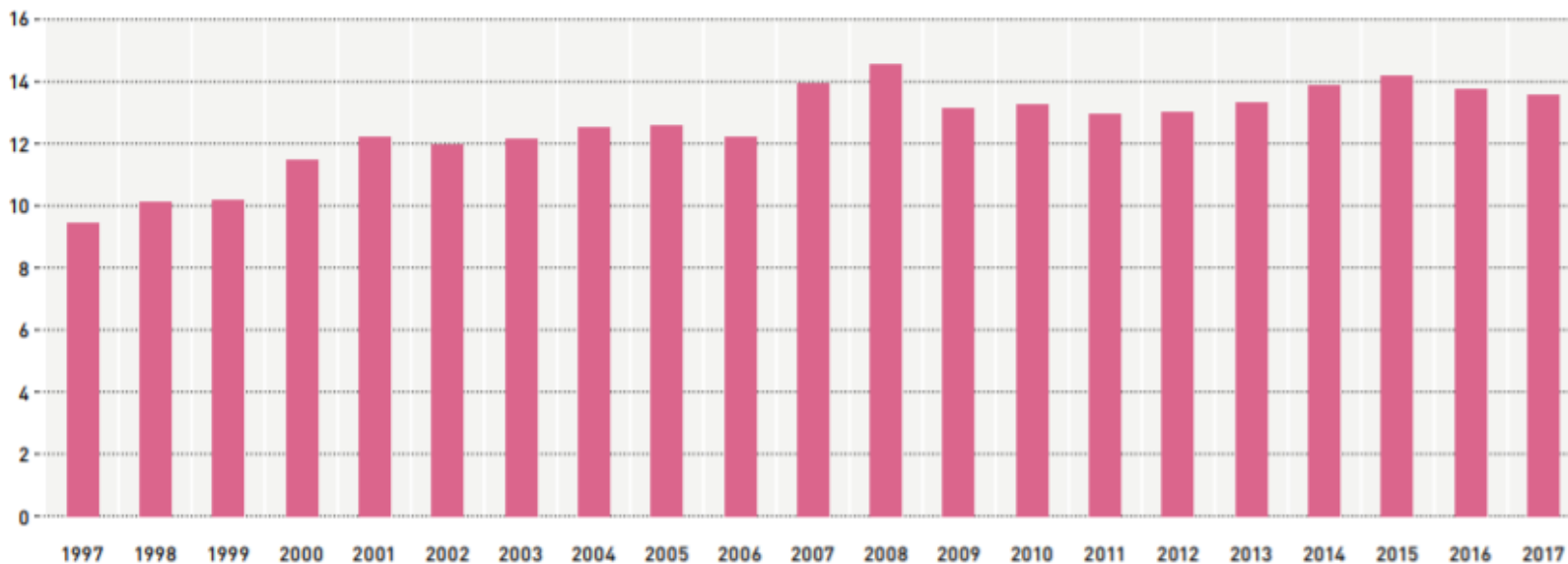
FIGUR 21 UTSLIPP AV CO 2 -EKVIVALENTER PÅ NORSK SOKKEL (MILL. TONN)